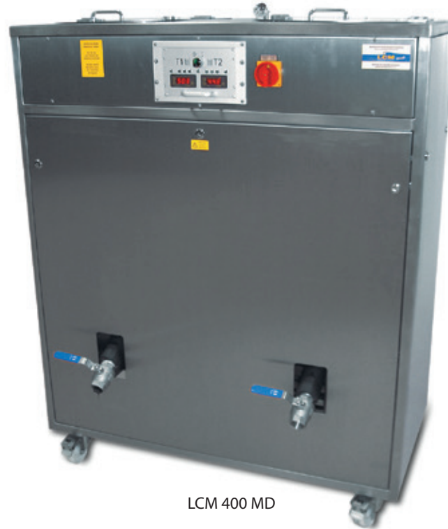
LCM 400 MD

Les fondoirs à chocolat se nettoient facilement. L'isolation de haute qualité des cuves permet de réduire fortement la consommation d'électricité.