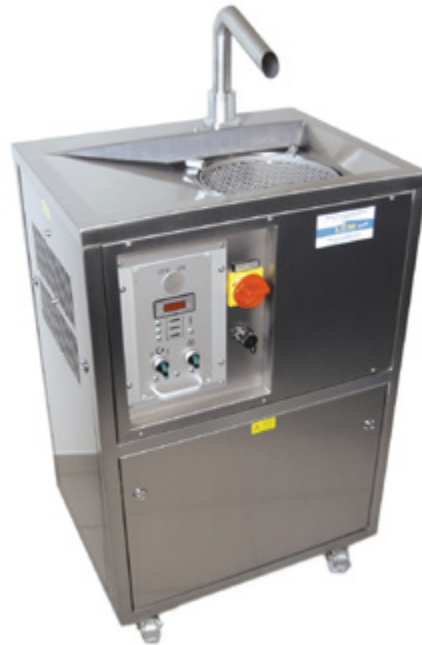
LCM 25 AT

Bedienung, Schokoladenwechsel und Reinigung sind bei diesen Modellen sehr einfach.