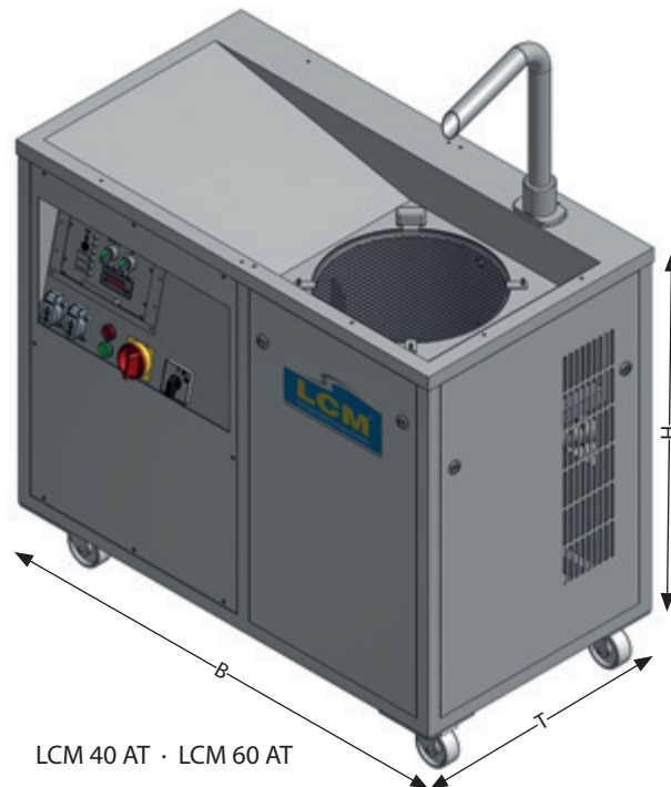
LCM 40 AT · LCM 60 AT