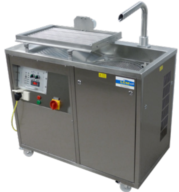
LCM 40 AT · LCM 60 AT